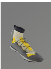
TRS 1 ECAL/Sebastian Maluska

TRS 1 est une chaussure de course avec une semelle extérieure interchangeable, qui permet à l'utilisateur de personnaliser sa propre paire. La chaussure intérieure peut être changée pour s'adapter à des températures plus froides ou plus chaudes, voire même pour être lavée en cas de besoin. Autre avantage : certaines parties de la chaussure peuvent être facilement réparées ou remplacées si elles sont usées ou endommagées.