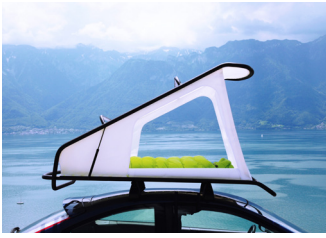
Nest ECAL/Sebastian Maluska

Nest est une extension de volume compacte pour le toit des voitures, servant à la fois de tente et d'espace de rangement. Inspirée par le monde de la voile et sa technologie, composée de deux cadres en aluminium recouverts de tissu imperméable, Nest offre, une fois déployée, un espace de couchage abrité et confortable pour deux personnes. Pendant la conduite, de l'équipement sportif tel que des planches de surf ou des skis peut être fixé sur le cadre supérieur ou à l'intérieur, entre les deux cadres.