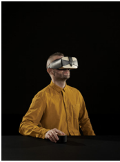
Chronogram Image: EPFL+ECAL Lab/Daniela & Tonatiuh

L'EPFL+ECAL Lab confère au casque VR une nouvelle identité, en le confrontant au cuir et au savoir-faire artisanal.