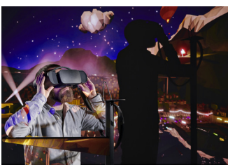
Scene-o-Scope EPFL+ECAL Lab/Daniela & Tonatiuh

Entering the cultural and museum space, the VR installation Roger Tallon: Archives in Motion by the EPFL+ECAL Lab gives access to a world that is usually inaccessible, the collection of sketches and images that French designer Roger Tallon has deposited at the Musée des arts décoratifs in Paris.