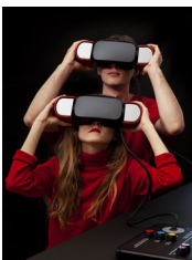
Roger Tallon: Archives in Motion

Nina , the immersive and nomadic installation of the EPFL+ECAL Lab, developed in collaboration with the space conception laboratory ALICE, drives the Montreux Jazz Festival heritage to new audiences.